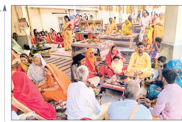
गुना। अखिल विश्व गायत्री परिवार शालिकुंज हरिद्वार के मार्गदर्शन में गायत्री शक्तिपीठ गुना पर नवरात्रि के प्रथम दिन पर गायत्री शक्ति पीठ गुना पर साधना कक्ष का भी शुभारंभ किया गया। साथ ही पंच कुंडी गायत्री मठछ के साथ दशक संस्कार, पुष्पदान संस्कार, नामकरण संस्कार, अन्नप्राशन संस्कार हुए। गायत्री परिवार के प्रमुख ट्रस्टी, सहायक प्रबंधक ट्रस्टी एवं युवा प्रकोष्ठ के जिला समन्वयक उपस्थित रहे।