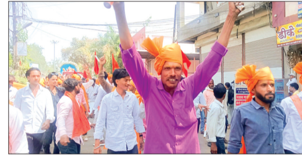
शुभकामनाएं दीं और मंगलकामनाएं व्यक्त कीं। वहीं मानस भवन में

हिंदू नव वर्ष, चैत्र प्रतिपदा एवं विक्रम संवत् 2083 के शुभारंभ पर शहर में धार्मिक आस्था और उत्साह का माहौल देखने को मिला। चैत्र नवरात्रि के प्रथम दिन प्रातःकाल सनातन धर्मावलंबी बड़ी संख्या में टेकरी सरकार के दरबार पहुंचे, जहां श्रद्धालुओं ने सूर्य उपासना कर नववर्ष का स्वागत किया। इस अवसर पर विशेष धार्मिक अनुष्ठान भी संपन्न हुए। शहर में विभिन्न हिंदूवादी संगठनों द्वारा भगवान श्रीराम की भव्य शोभा यात्रा निकाली गई, जिसमें बड़ी संख्या में श्रद्धालु शामिल हुए। यात्रा के दौरान