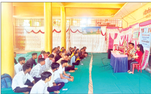
दौरान थाना प्रभारी द्वारा छात्र-छात्राओं को समाज में व्याप्त आठ