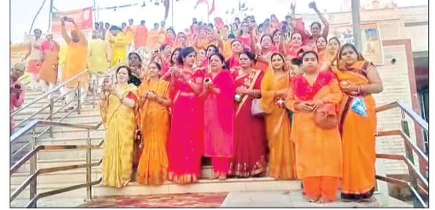
हरिभूमि न्यूज गुना

हिंदू नव वर्ष, चैत्र प्रतिपदा एवं विक्रम संवत् 2083 के शुभारंभ पर शहर में धार्मिक आस्था और उत्साह का माहौल देखने को मिला। चैत्र नवरात्रि के प्रथम दिन प्रातःकाल सनातन धर्मावलंबी बड़ी संख्या में टेकरी सरकार के दरबार पहुंचे, जहां श्रद्धालुओं ने सूर्य उपासना कर नववर्ष का स्वागत किया। इस अवसर पर विशेष धार्मिक अनुष्ठान भी संपन्न हुए। शहर में विभिन्न हिंदूवादी संगठनों द्वारा भगवान श्रीराम की भव्य शोभा यात्रा निकाली गई, जिसमें बड़ी संख्या में श्रद्धालु शामिल हुए। यात्रा के दौरान